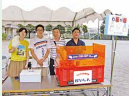
南足柄支店(平成28年7月23日)