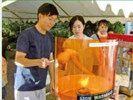
中町支店(平成28年7月30日)