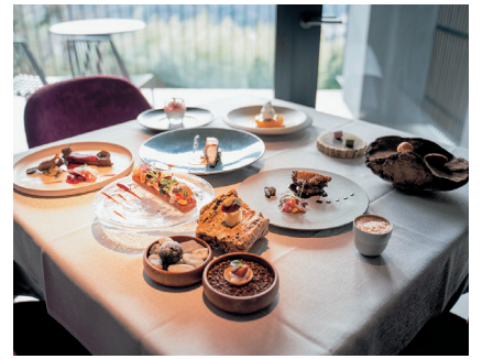
厳選食材によるNICAの食事