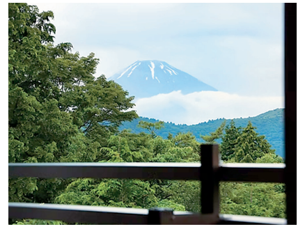
箱根湯宿 然・ZEN・ から見た富士山