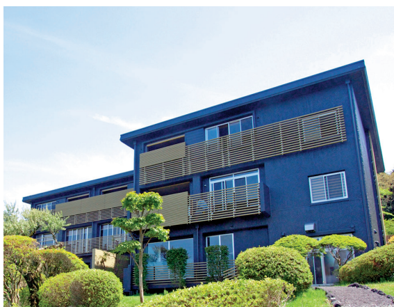
箱根湯宿 然 -ZEN-